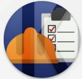
공사 및 시설물

코러스(KORUS, KOREAN university Resource United System)는 상호 조화와 협력을 상징하는 것으로 국립대학의 인적 물적 자원을 통합한 행 재정자원관리 시스템입니다.