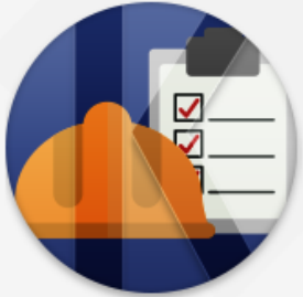
공사 및 시설물

코러스(KORUS, KOrean university Resource United System)는 상호 조화와 협력을 상징하는 것으로 국립대학의 인적·물적 자원을 통합한 행 재정자원관리 시스템입니다.